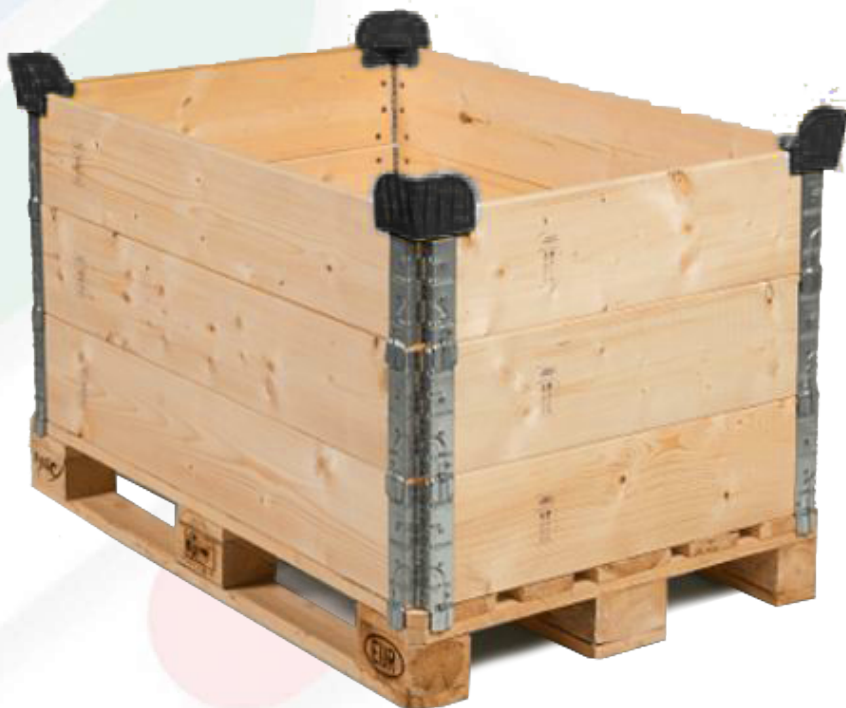
Esempio di utilizzo